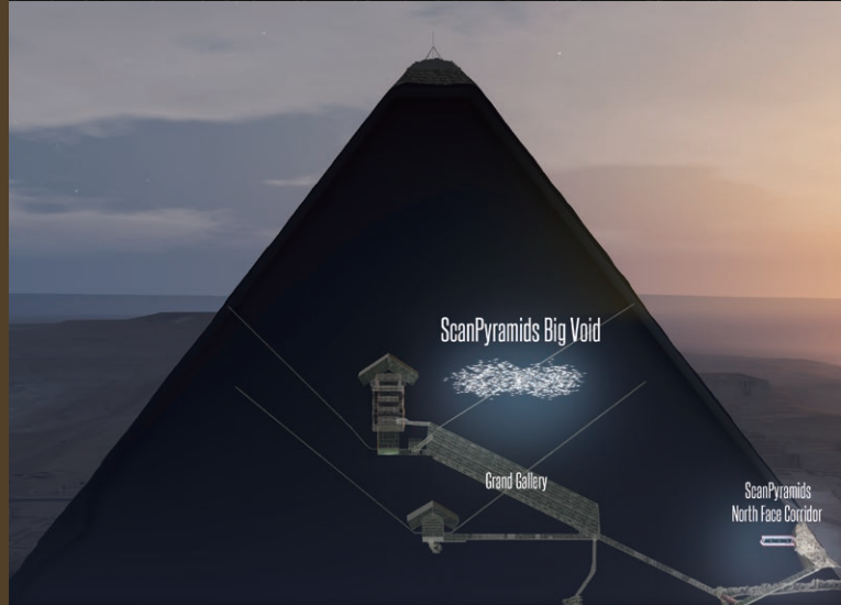
大ピラミッド内部の未知の空間