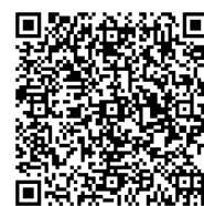
名古屋大学基金 QRコード

問い合わせ先まで電話またはEメールでご連絡ください。専用の振込用紙を送付させていただきます。